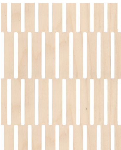
LINAR: bach side Plywood Birch 9 mm